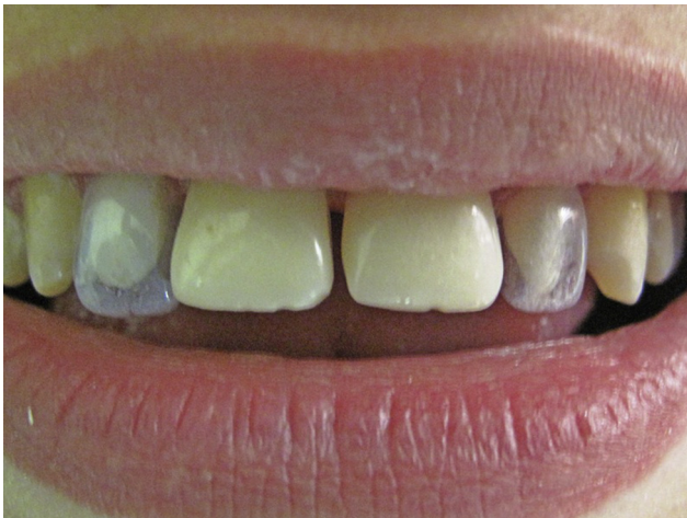
Figura 3 Prueba y selección de preformas plásticas en laterales previas al tratamiento restaurador.

rico al 35% (3M®). Se lavó, se secó para aplicar el adhesivo o single-bond (3M) a los dientes correspondientes, se realizó el llenado con resina compuesta de la cofia a adaptar (resina filtex-supreme Z350 3M®). A las cofias se les realizó una mínima perforación en la zona correspondiente al borde incisal que permitió la salida del excedente de resina una vez posicionada la cofia en el diente para evitar que se formaran burbujas (ver figs. 2 y 3), se fotopolimerizó durante 30s. Posteriormente se retiraron las cofias, cortándolas de cervical a incisal con una hoja de bisturí #15 para no rayar la resina. Luego se levantó la cofia con una pinza Kelly. Las carillas fueron realizadas comenzando por línea media, de esta manera se realizaron inicialmente los centrales, luego laterales y por último los caninos.