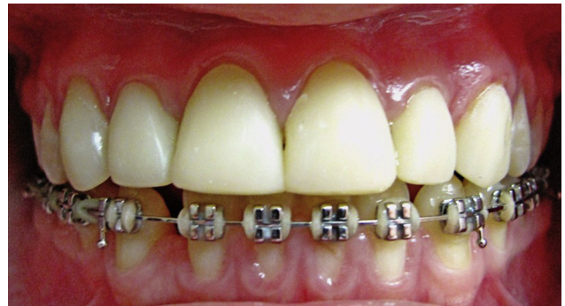
Figura 4 Tratamiento restaurador culminado con cofias de resina en centrales, laterales y caninos.