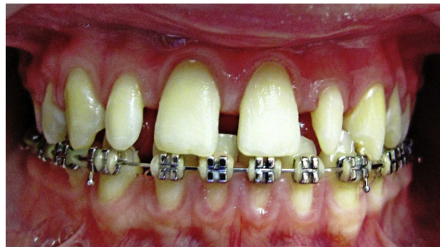
Figura 1 Foto inicial. Diastemas en maxilar superior y laterales en forma de clavija.

En la fase clínica, una vez seleccionadas las preformas, se fueron probando una a una en los dientes correspondientes y, posterior a esto, se procedió a hacer la desmineralización del esmalte de los respectivos dientes con ácido ortofosfó-