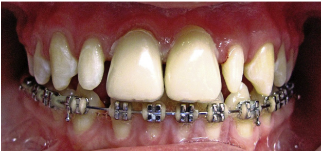
Figura 2 Preformas plásticas cargadas con resina y adaptadas en centrales.